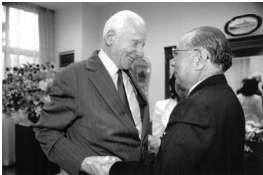
El doctor Joseph Rotblat, laureado con el Premio Nobel de la Paz y presidente emérito de las Conferencias Pugwash sobre Ciencias y Asuntos Mundiales, junto con el presidente de la SGI Ikeda (febrero de 2000).