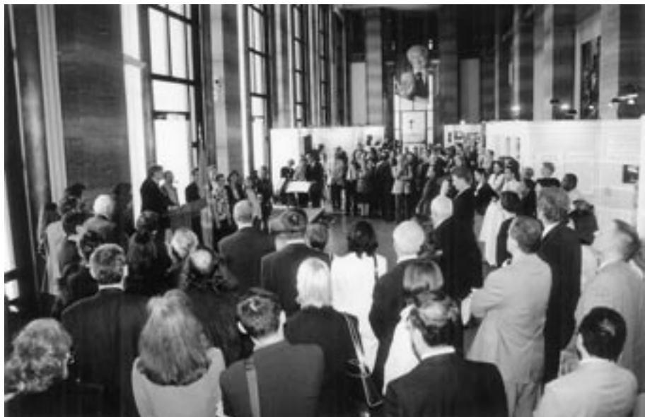
Exhibición "Linus Pauling y el siglo XX: Búsqueda de la humanidad", en la sede europea de las Naciones Unidas, Ginebra, Suiza (abril de 2003).

países con diferentes sistemas sociales e ideologías; se estima que el público que la presencié asciende a un millón doscientas mil personas.