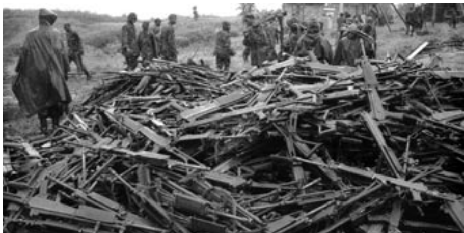
Armas y minas de guerra incautadas por el ejército de Ruanda; destruidas posteriormente el 13 de abril de 2005.

Tráfico Ilícito de Armas Pequeñas y Ligeras en Todos sus Aspectos, y adoptó un programa de acción para “prevenir, combatir y erradicar” el mercado de armas. 84