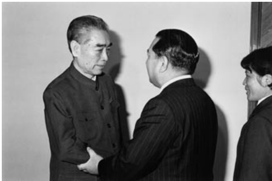
El autor junto al primer ministro Zhou Enlai, diciembre de 1974.

Cuando en diciembre del mismo año viajé a la China, fui portador de ese mensaje, que transmití fielmente a los líderes del gobierno chino. Fue durante dicha visita cuando conocí al primer ministro Zhou Enlai (1898-1976), ocasión en que ambos nos embarcamos en un diálogo acerca de la importancia de ahondar y de fortalecer la amistad entre la China y el Japón, y de esforzarnos juntos por el bienestar del mundo entero. 2