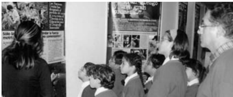
Exhibición “Semillas del cambio: la Carta de la Tierra y el potencial humano”, en la Universidad Nacional Mayor de San Marcos, Perú (junio de 2004).

Concretamente, la SGI ha presentado la exhibición “Semillas del cambio: la Carta de la Tierra y el potencial humano” (organizada en forma conjunta por la SGI y la Iniciativa de la Carta de la Tierra) en más de diez países; estamos planificando además una nueva exhibición sobre ética global y la Carta de la Tierra, que se presentará en Japón a partir de este año.