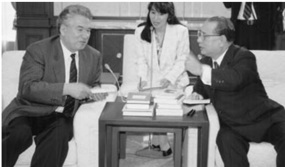
Diálogo del presidente de la SGI, Daisaku Ikeda, y el escritor, Chingiz Aitmatov.

“¡Cuán hermoso y legítimo suena el “yo” pleno de Goethe! Es el “yo” de la más pura relación con la naturaleza”. 28 Al tiempo que ensalza el aspecto panteísta de Goethe, Buber se identifica con San Francisco de Asís, religioso del siglo XIII reconocido como el patrono de los ecologistas, quien mantenía íntimas conversaciones con los pájaros, las plantas y las piedras. 29