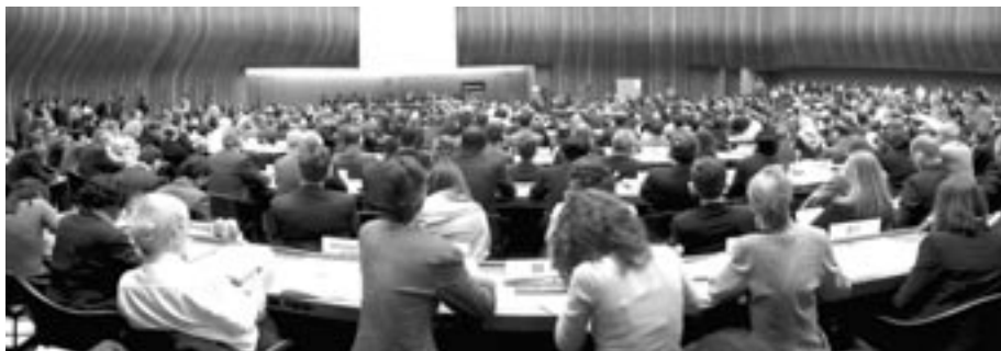
"Programa Mundial para la Educación en Derechos Humanos" adoptado por la Comisión de Derechos Humanos de la ONU.

El Programa Mundial para la Educación en Derechos Humanos, iniciado en 2005, brinda una oportunidad única y vital en ese sentido. 22 La necesidad perentoria de seguir luchando incansablemente en el plano internacional para establecer una educación en los derechos humanos es una de mis preocupaciones más constantes; en una declaración escrita que presenté ante la Conferencia Mundial contra el Racismo, la Discriminación Racial, la Xenofobia y las Formas Conexas de Intolerancia, realizada hace cuatro años en Durban, Sudáfrica, exhorté a que se hiciera todo lo posible en ese sentido. La SGI ha puesto enorme empeño, junto con otras organizaciones no gubernamentales (ONGs), agencias de la ONU y representantes de estados miembros de la ONU, para incentivar la adopción de dicho programa. La Comisión de Derechos Humanos adoptó la recomendación de proclamar el programa mundial en abril de 2004; este fue establecido formalmente por resolución de la Asamblea General de la ONU en diciembre del mismo año, y se concentrará, en los primeros tres años (2005-2007), en integrar temas relativos a los derechos humanos en los sistemas de las escuelas primarias y secundarias.