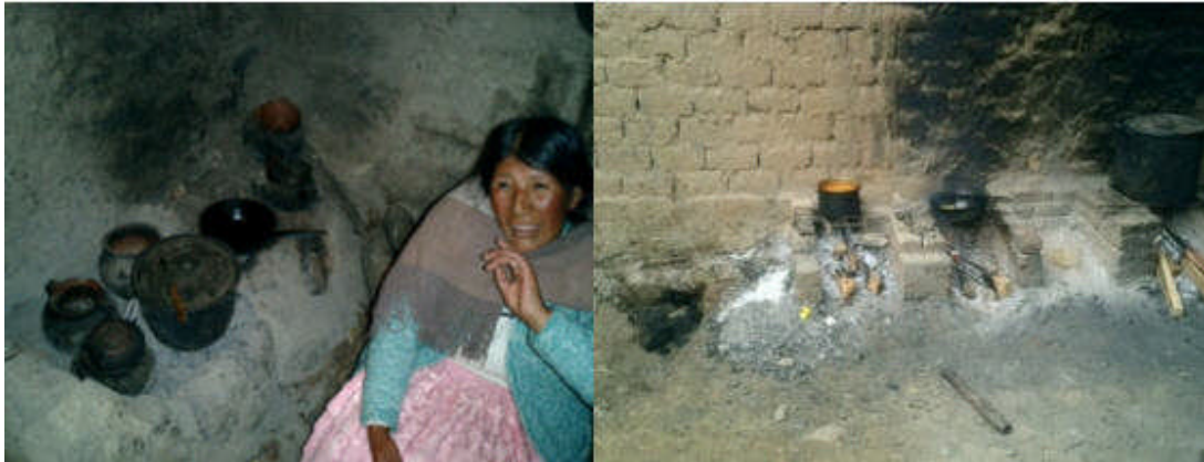
Problemática Ambiental-energética, inadecuado manejo de residuos y fuentes de energía ineficiente.