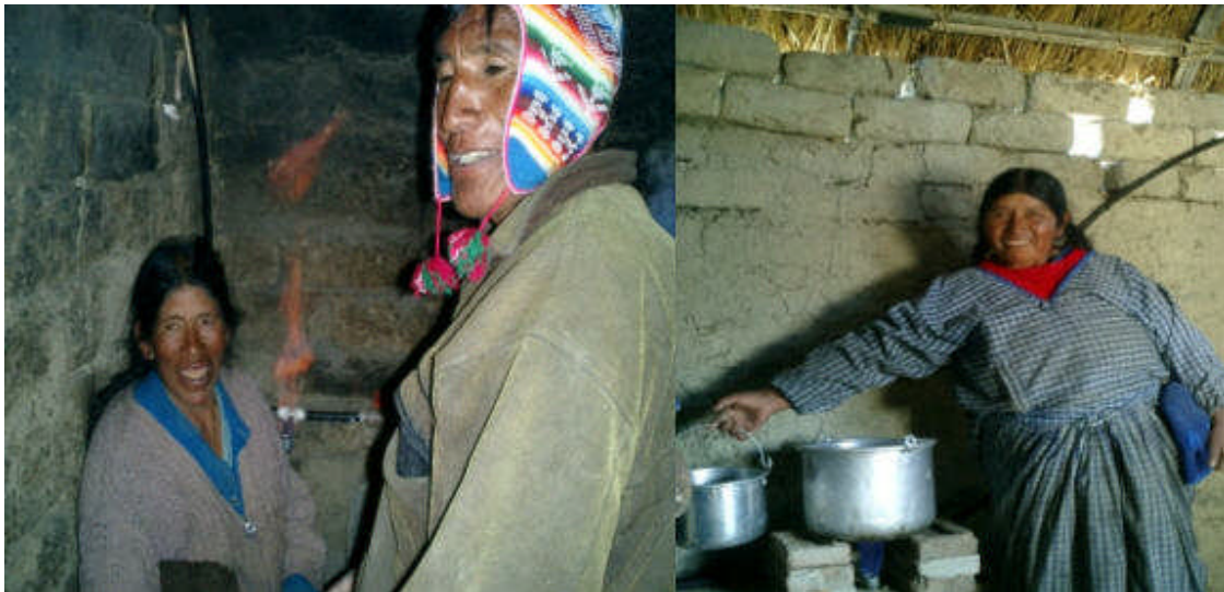
Uso del Biogás en el altiplano Boliviano

Se puede afirmar que sin la implementación del proyecto, los aspectos anteriormente vistos - aquellos intangibles - como la salud, comodidad, seguridad y simplificación del trabajo se ven seriamente afectados y por tanto la calidad de vida seguirá en detrimento.