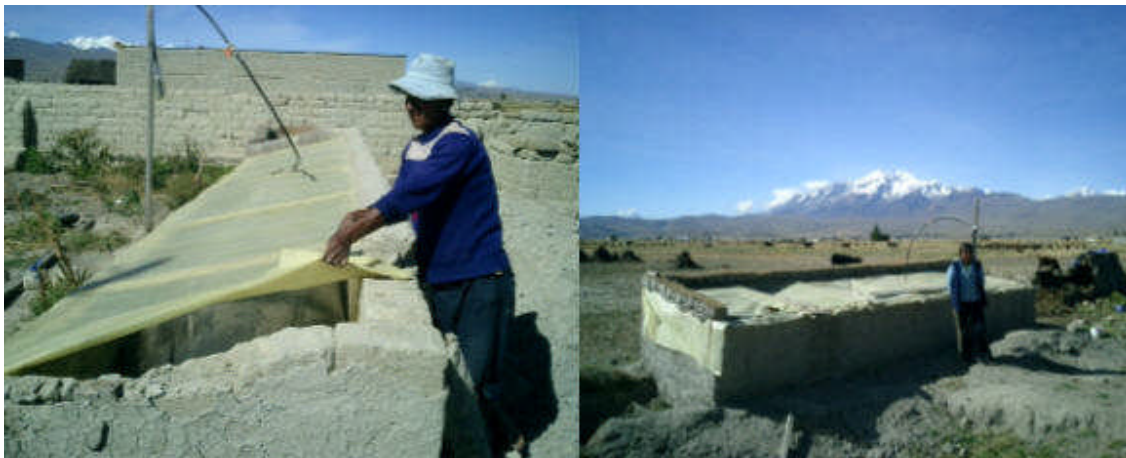
Biodigestores Instalados en Altiplano, cerca lago Titicaca

El proyecto ha generado la instalación de cerca de 250 biodigestores de bajo costo, de manera pionera en Bolivia y en condiciones de valle, altiplano (4000msnm) y trópico; es en ese sentido que los resultados de este proyecto nos dan la posibilidad de poder extrapolar los resultados obtenidos de la difusión y replica de esta tecnología, los resultados hasta ahora logrados por el proyecto son satisfactorios, actualmente se tiene instalados sistemas en diferentes ecoregiones.