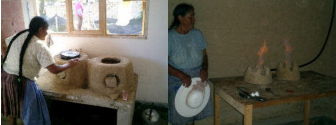
Cocinas mejoradas con el uso de biogás como combustible ( La Paz, Cochabamba y Santa Cruz)

han limitado la energización rural. Asimismo para canalizar los esfuerzos locales y la cooperación internacional en forma sinérgica y complementaria