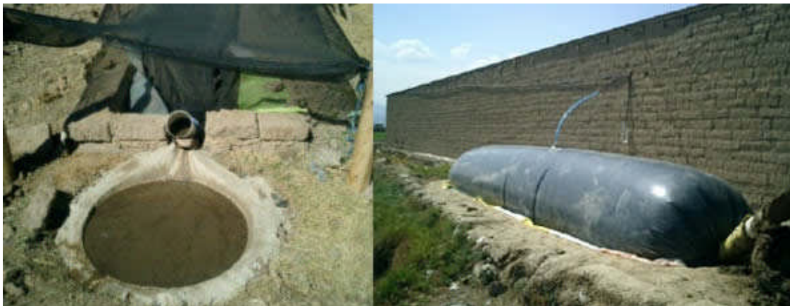
Producción de Biofertilizantes, producto de la biodigestión anaerobia