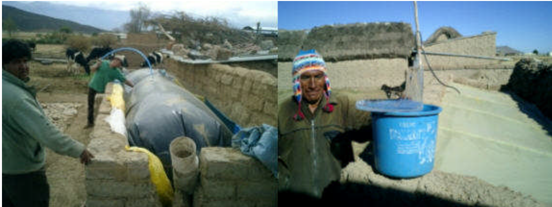
Biodigestor en el valle Biodigestor en el altiplano

El biodigestor, es un sistema sencillo de implementa, con materiales económicos, que se están introduciendo en comunidades rurales aisladas y de países subdesarrollados; para obtener el doble beneficio de conseguir solventar la problemática energética-ambiental, así como realizar un adecuado manejo de los residuos tanto humanos como animales.